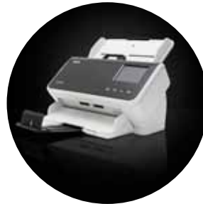
Escáneres S2060w/S2080w Alaris